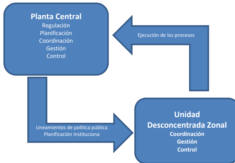
Gráfico 1. Relacionamiento institucional interno del Instituto Nacional de Donación y Trasplante de Órganos, Tejidos y Células (INDOT)

Elaboración: Dirección de Planificación y Gestión Estratégica – INDOT, 2026